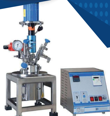
Reactores de alta presión con capacidades que van desde 25ml. a 100 ltr.

NUESTRO EQUIPO DE EXPERTOS LE ASESORARÁ PARA ENCONTRAR EXACTAMENTE LO QUE ESTÁ BUSCANDO