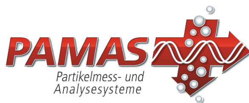
Contador de partículas para muestreo de aceites