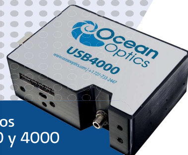
Espectrómetros de la serie USB2000 y 4000