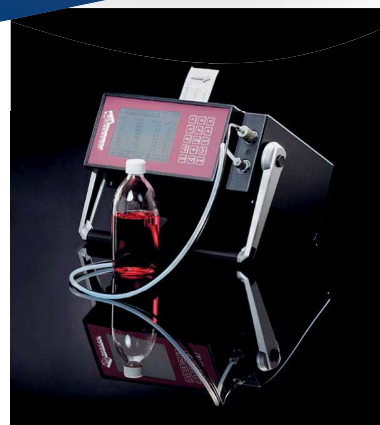
Contador de partículas portátil para cualquier tipo de aceite