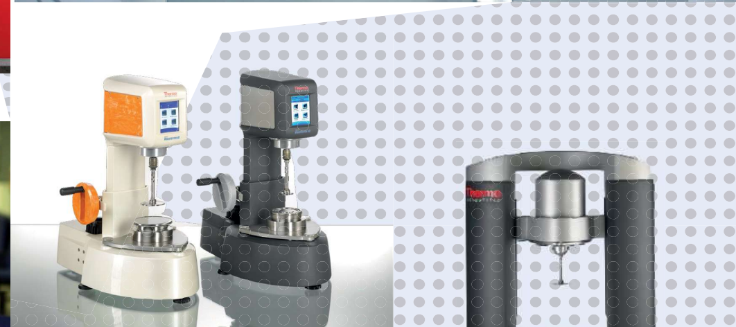
Reómetros HAAKE™ Viscotester™ iQ