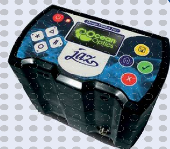
Espectrómetro de mano para medidas de UV-Vis