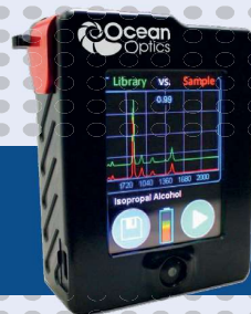
Sistema Raman portátil